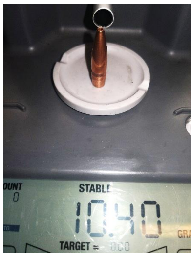
308 Win. Før

Perfekt ekspansion og som regel 100% restværdi.