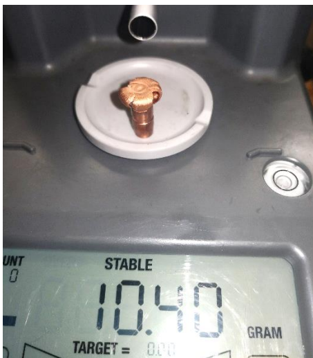
308 Win. Efter