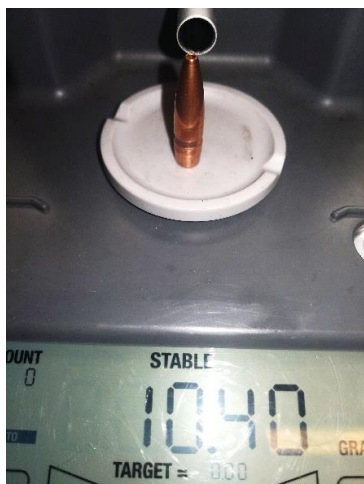
308 Win. Før

Perfekt ekspansion og som regel 100% restværdi.